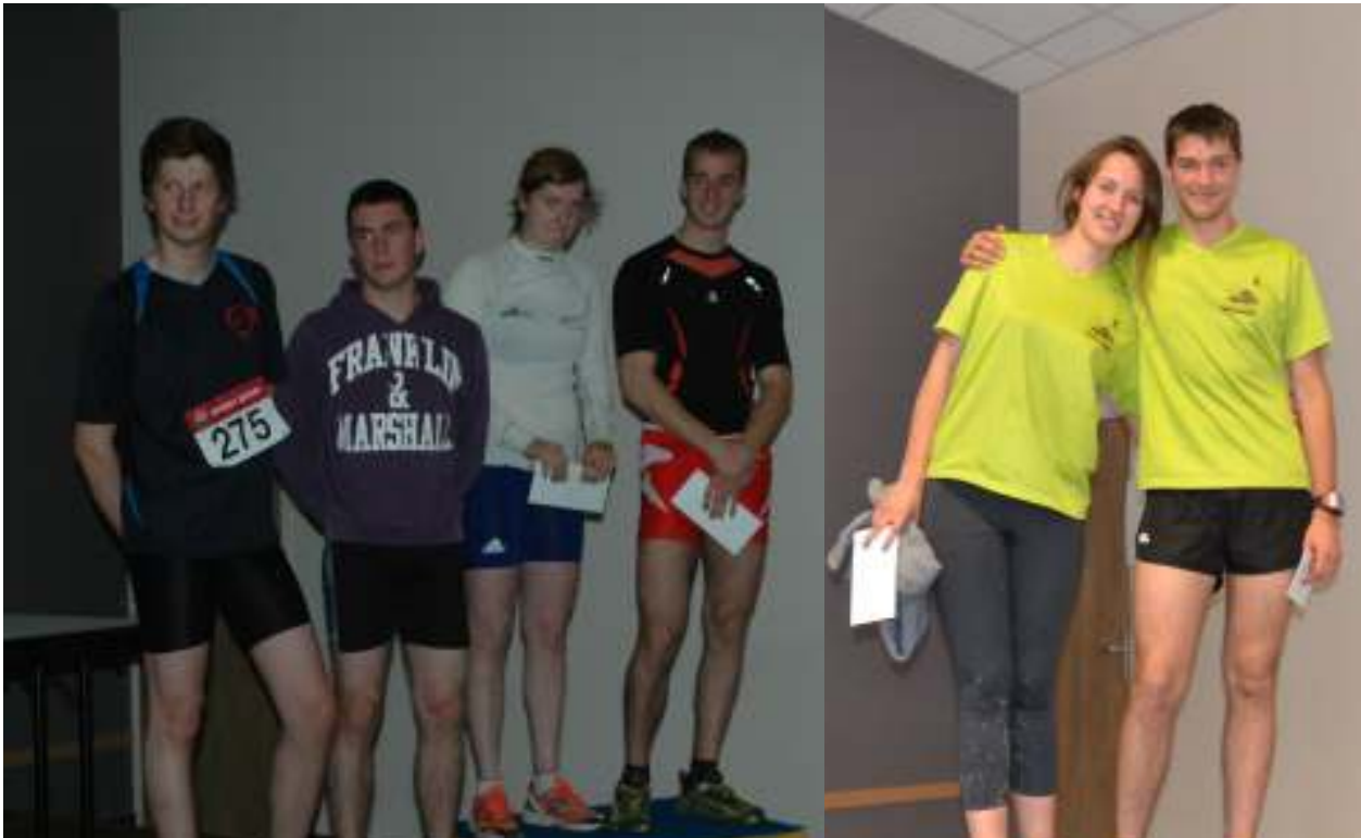
Les récompensés de la Bouclette