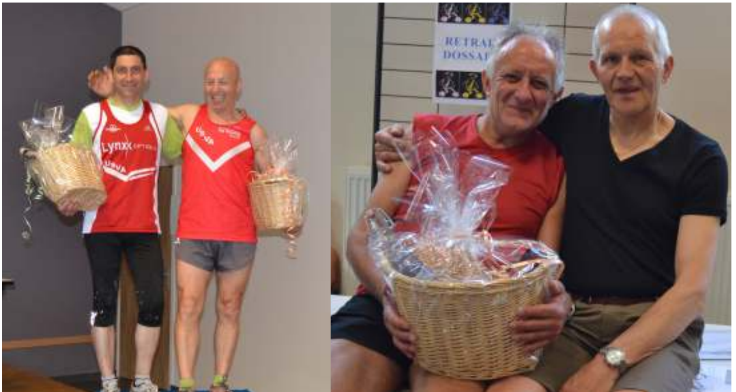
Honneur aux vétérans