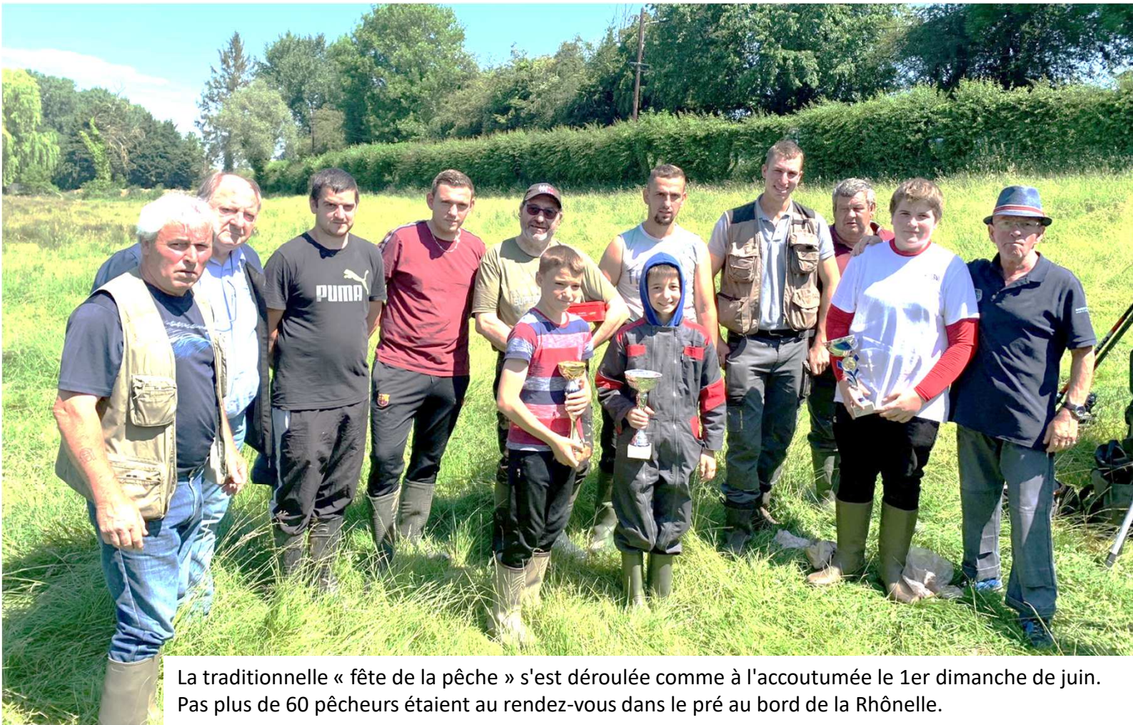
La traditionnelle « fête de la pêche » s'est déroulée comme à l'accoutumée le 1er dimanche de juin. Pas plus de 60 pêcheurs étaient au rendez-vous dans le pré au bord de la Rhône.

A cette occasion, un rempoissonnement de 120kg de truites a été effectué.